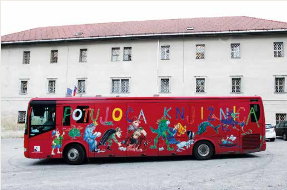
Der Bücherbus Ljubljana vor der CFI-Justizvollzugsanstalt für Frauen in Slowenien

oder Geldstrafen befreit. Jede Nutzerin kann Material wie Bücher, DVDs und CDs reservieren. Es besteht auch die Möglichkeit, die Leihfrist um 75 Tage zu verlängern.