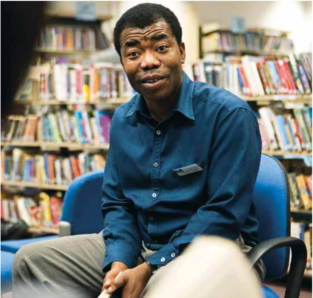
Ein Bibliotheksmitarbeiter in England

Sie sind ein Tor zur Förderung von Bildung. In Luzira zum Beispiel haben viele Teilnehmer des Buchclubs gesagt, dass ihre neue Liebe zum Lesen sie dazu veranlasst hat, ihre schulische Ausbildung abzuschließen, die sie als Kinder nicht wahrnehmen konnten (ebd.).