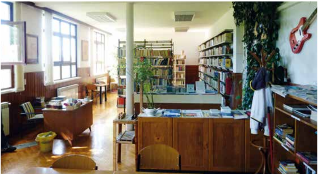
Gefängnisbibliothek von Valtura, Kroatien