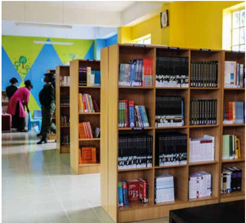
Die Jones Day Women and Children Library des Lang'ata Women's Prison in Nairobi, Kenya

Leseförderung abdecken, das den Bildungs-, Informations- und Erholungsbedürfnissen ihrer Benutzerinnen und Benutzer entgegenkommt. Das bloße Bereitstellen von gedruckten und digitalen Lesematerialien schöpft die vielen Fähigkeiten und Möglichkeiten nicht aus, die eine Gefängnisbibliothek vermitteln und bieten könnte. Dazu gehören Öffentlichkeitsarbeit und Leseförderung, wie Lesekreise und Buchclubs, kreatives Schreiben (einschließlich Gedichte und Kurzgeschichten) und Debattiergruppen, Autorenbesuche, Poetry Slams und Theaterworkshops.